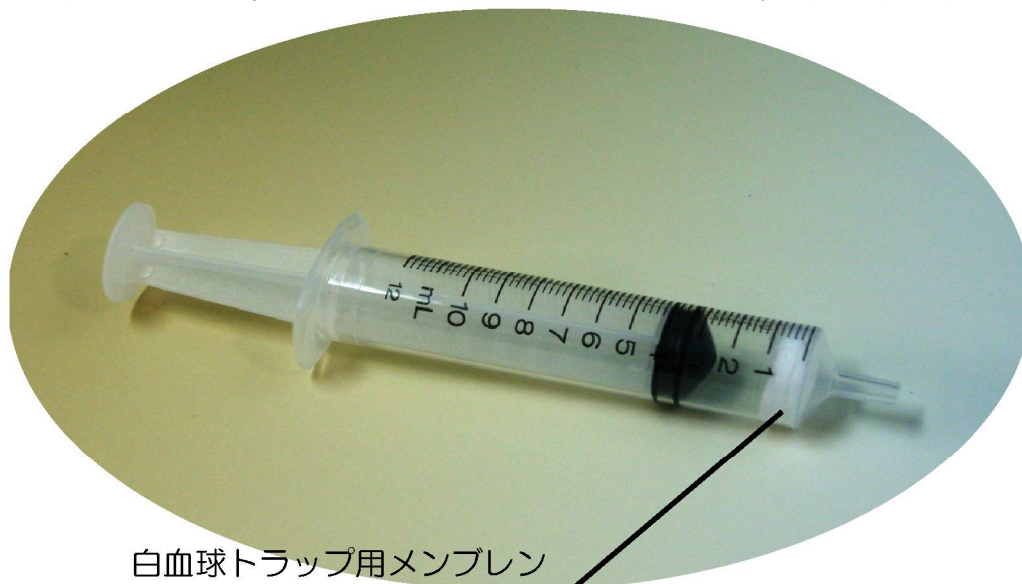
白血球トラップ用メンブレン